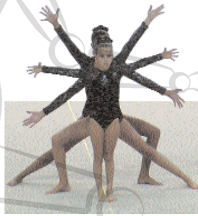
Creacions amb una finalitat estètica